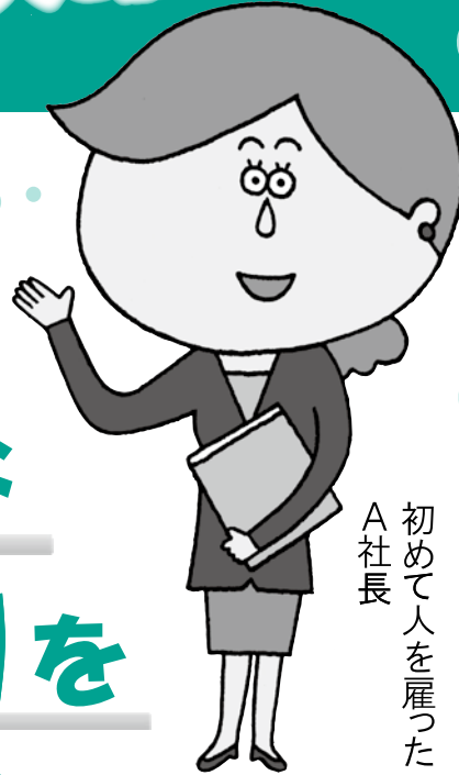
A社長 初めて人を雇った